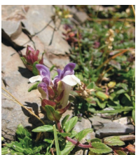
Pyramiden-Günsel ( Ajuga pyramidalis )