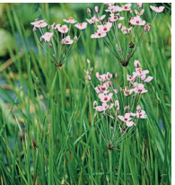
Blumen-Binse ( Scheuchzeria palustris )

Familie der Sauergrasgewächse (Cyperaceae)