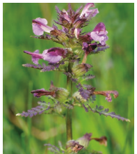
Sumpf-Läusekraut ( Pedicularis palustris )

Familie der Sommerwurzgewächse (Orobanchaceae)