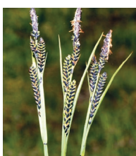
Braun-Segge ( Carex nigra )

Familie der Sauergrasgewächse ( Cyperaceae )