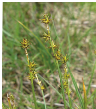
Igel-Segge ( Carex echinata )

Familie der Sauergrasgewächse ( Cyperaceae )