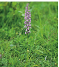
Händelwurz ( Gymnadenia conopsea )