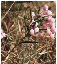
Rosmarinheide ( Andromeda polifolia )

Familie der Heidekrautgewächse (Ericaceae)