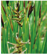
Davalls Segge ( Carex davalliana )

Familie der Sauergrasgewächse ( Cyperaceae )