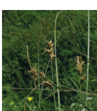
Schmalblättrige Stachel-Segge ( Carex pairae )

Familie der Sauergrasgewächse ( Cyperaceae )