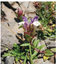
Alpen-Helmkraut ( Scutellaria alpina )