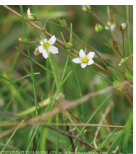
Purgier-Lein ( Linum catharticum )