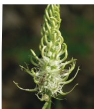
Ährige Teufelskralle ( Phyteuma spicatum )

Familie der Glockenblumengewächse (Campanulaceae)