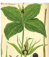
Einbeere ( Paris quadrifolia )

Familie der Germergewächse (Melanthiaceae)