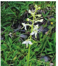
Zweiblättrige Waldhyazinthe ( Platanthera bifolia )