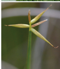
Armlütige Segge ( Carex pauciflora )

Familie der Sauergrasgewächse ( Cyperaceae )