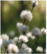
Scheiden-Wollgras ( Eriophorum vaginatum )

Familie der Sauergrasgewächse (Cyperaceae)