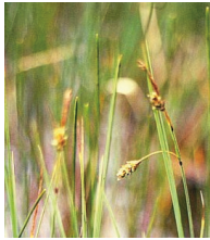
Schlamm-Segge ( Carex limosa )

Familie der Sauergrasgewächse ( Cyperaceae )