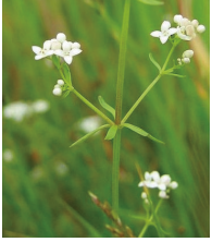
Sumpf Labkraut ( Galium palustre )