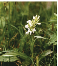
Weisses Knabenkraut ( Dactylorhiza majalis albino )