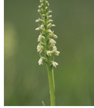
Weissorchis ( Leucorchis albida )