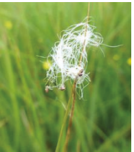
Alpenhaar-Binse ( Persicaria alpina )

Familie der Blumenbinsengewächse (Scheuchzeriaceae)