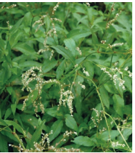
Alpen-Knöterich ( Persicaria alpina )

Familie der Knöterichgewächse ( Polygonaceae )