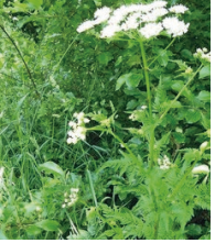
Behaarter Kälberkropf ( Chaerophyllum hirsutum )