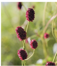
Grosser Wiesenknopf ( Sanguisorba officinalis )