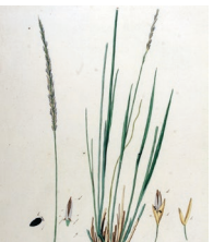
Kleines Pfeifengras ( Molinia caerulea )

Familie der Simsenliliengewächse (Tofieldiaceae)