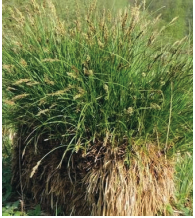
Rispensegge ( Carex panucolata )

Familie der Sauergrasgewächse (Cyperaceae)