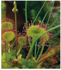
Rundblättriger Sonnentau ( Drosera rotundifolia )

Familie der Sonnentaugewächse (Droseraceae)