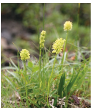
Lilien Simse ( Tofieldia calyculata )

Familie der Simsenliliengewächse (Tofieldiaceae)