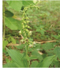
Breitblättriger Sumpfwurz ( Epipactis helleborine )