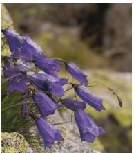
Scheuchzers Glockenblume ( Campanula scheuchzeri )

Familie der Glockenblumengewächse (Campanulaceae)