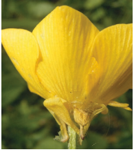
Knolliger Hahnenfuss ( Ranunculus bulbosus )

Familie der Hahnenfussgewächse ( Ranunculaceae )