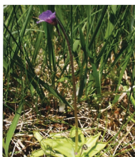
Gemeines Fettkraut ( Pinguicula vulgaris )

Familie der Wasserschlauchgewächse (Lentibulariaceae)