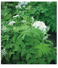
Behaarter Kälberkopf ( Chaerophyllum hirsutum )