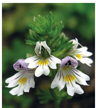
Augentrost ( Euphrasia rostkoviana )

Familie der Sommerwurzgewächse (Orobanchaceae)