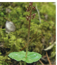
Kleines Zweiblatt ( Listera cordata )