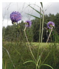
Gewöhnlicher Teufels- Abbiss ( Succisa pratensis )

Familie der Geißblattgewächse (Caprifoliaceae)